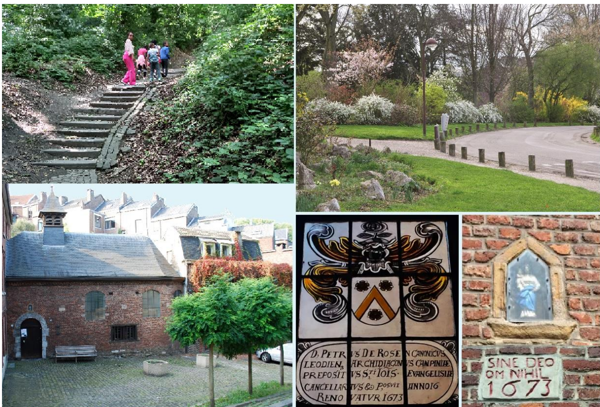
Marche de la Bergerie – vendredi 5 mai à 14 h – RDV à la MM Humilis