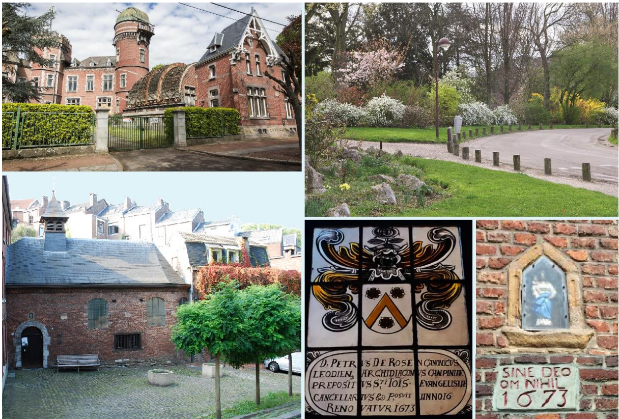
Marche de l'Arboretum – vendredi 8 juillet à 14 h – rdv à MM Humilis